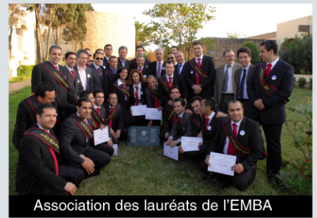
Association des lauréats de l'EMBA

- Demi-journée organisée par les participants du Mastère RH sur le thème :