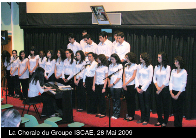
La Chorale du Groupe ISCAE, 28 Mai 2009