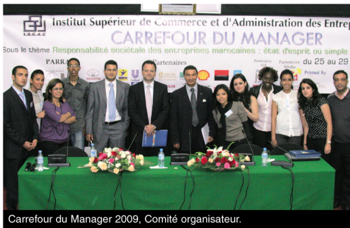
Carrefour du Manager 2009, Comité organisateur.

du cycle normal, qui s'est tenue le jeudi 28 mai à l'ISCAE Casablanca, a été donné par un séminaire portant sur la Responsabilité Sociale de l'Entreprise (RSE). Le choix du thème n'est pas fortuit, il s'inscrit dans la stratégie du Groupe ISCAE, qui vise à mettre sur le marché des lauréats combattifs, dynamiques, dotés d'un leadership, entrepreneurs et conscients de la qualité de l'environnement économique et social.