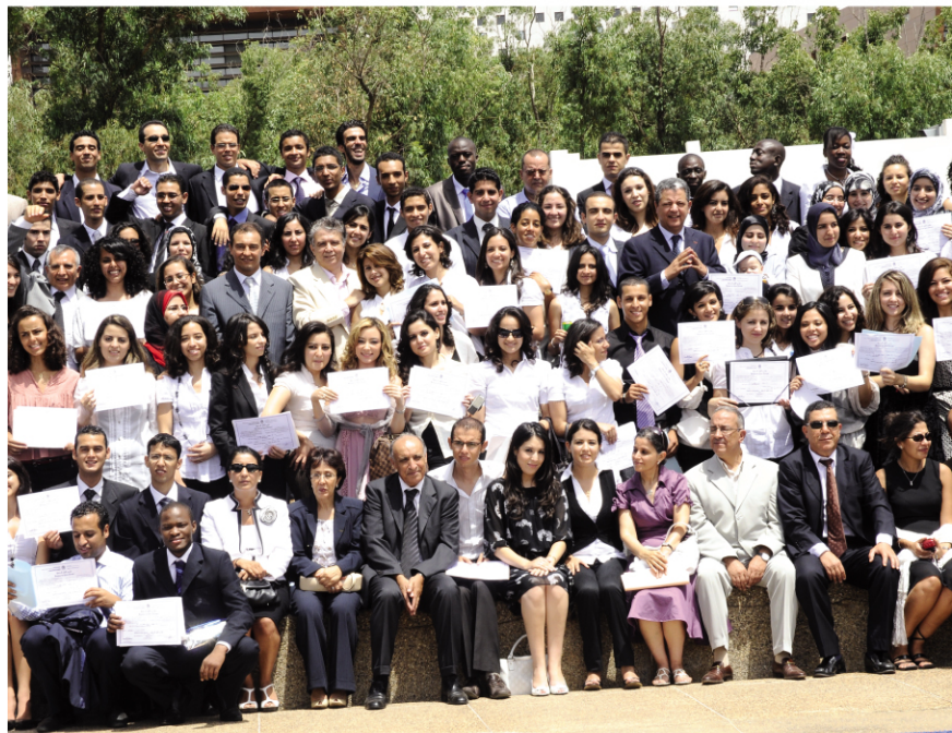
Cérémonie de remise des diplômes aux étudiants du Cycle normal 2007-2008

Tout a commencé lorsque l'institut a décidé de se doter d'un horizon, à se fixer des objectifs à atteindre, en s'inspirant de ce qui se fait de mieux à l'extérieur pour repositionner l'établissement. Pour ce faire, l'établissement a commandé son audit pédagogique à une ins-