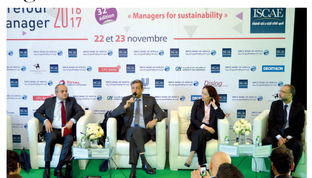
Cette manifestation a été marquée par la participation d'éminentes personnalités politiques et économiques.